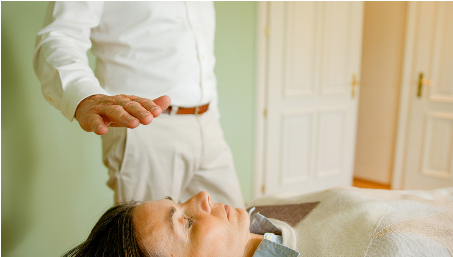
Abb. 3: Bei der Anwendung „Subtle Body Balance“ wird der Feinstoffkörper mit der Hand des Therapeuten aktiviert und in die Balance gebracht.

den physischen Körper überträgt. Wer lernt, seinen Feinstoffkörper wahrzunehmen und zu verstehen, kann diese Signale besser deuten und diese Reaktionen als Hinweis verstehen, etwas an der Situation zu verändern, bevor eine körperliche Stressreaktion auftritt. Sind wir feinstofflich jedoch in einem schlechten Zustand, kommen uns